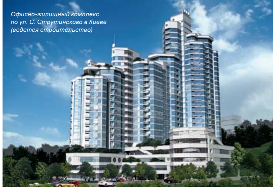
Офисно-жилищный комплекс по ул. С. Струтинского в Киеве (ведется строительство)

Второй момент сугубо исторический и психологический – это ландшафтный рекреационный парк, в котором крупное строительство запрещено. Хотя, честно говоря, парком эту территорию назвать трудно, это скорее довольно плотный лес – там так же страшно гулять. Но город пошел навстречу заказчику, ведь на площадке проектирования не нужно рубить очень много деревьев – там уже вполне «обжитой» «Куренями» участок.