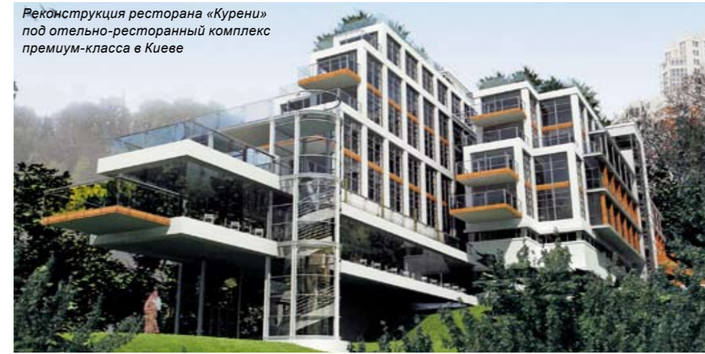
Реконструкция ресторана «Курени» под отельно-ресторанный комплекс премиум-класса в Киеве

– Архитектура – это творчество, требующее вдохновения. Откуда его черпаете вы?