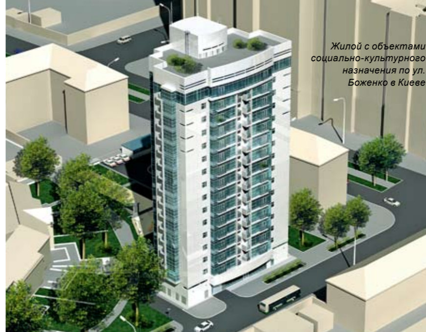
Жилой с объектами социально-культурного назначения по ул. Боженко в Киеве

Однако в то же время я и не сторонник бездумного уплотнения застройки немасштабными зданиями. Над городом нужно работать вдумчиво и постоянно. Старые кварталы тоже требуют переосмысления, дополнения.