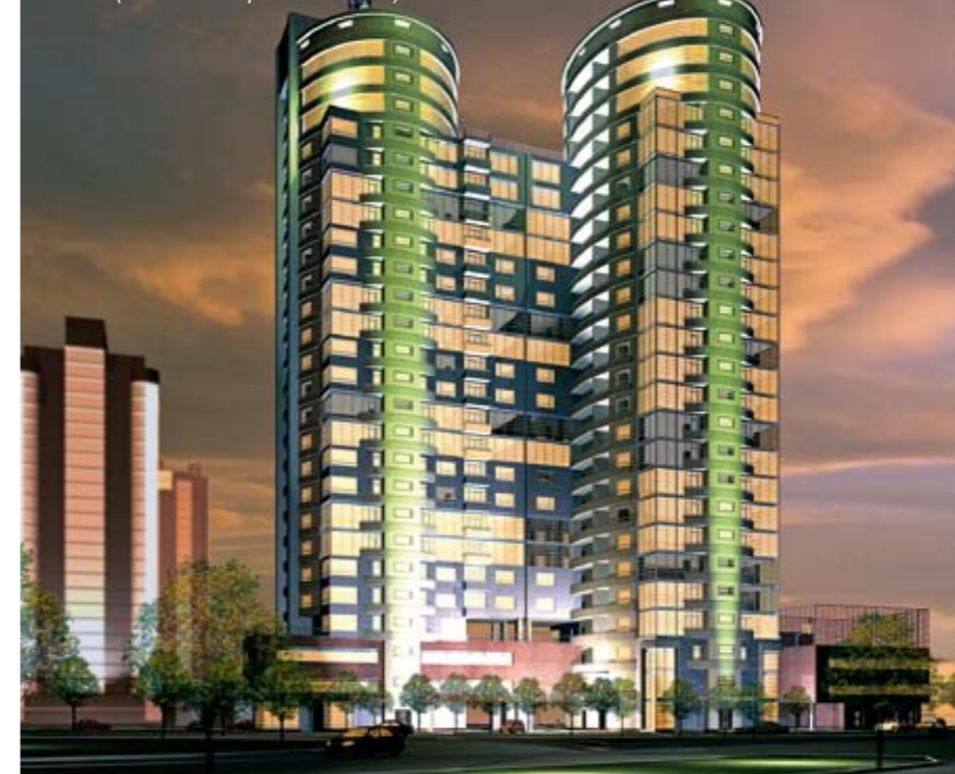
Дом с объектами гражданского назначения на пересечении ул. Ю. Шумского и Березняковская в Киеве (ведется строительство)